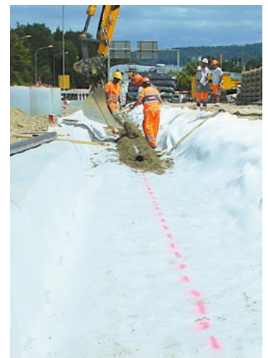
Impermeabilizzazione di perimetri