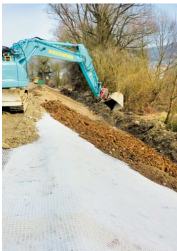
Argine di protezione contro piene del fiume