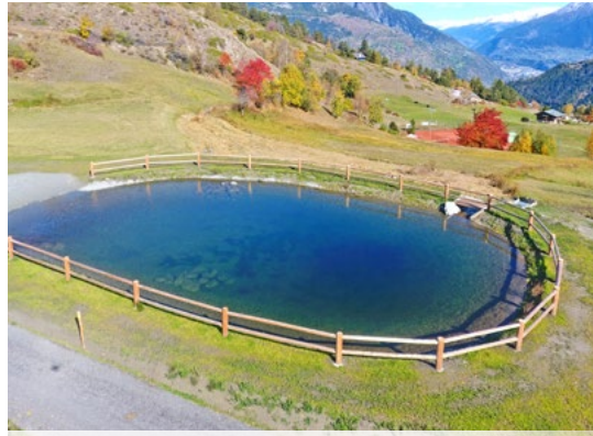
Impermeabilizzazione di bacino antincendio