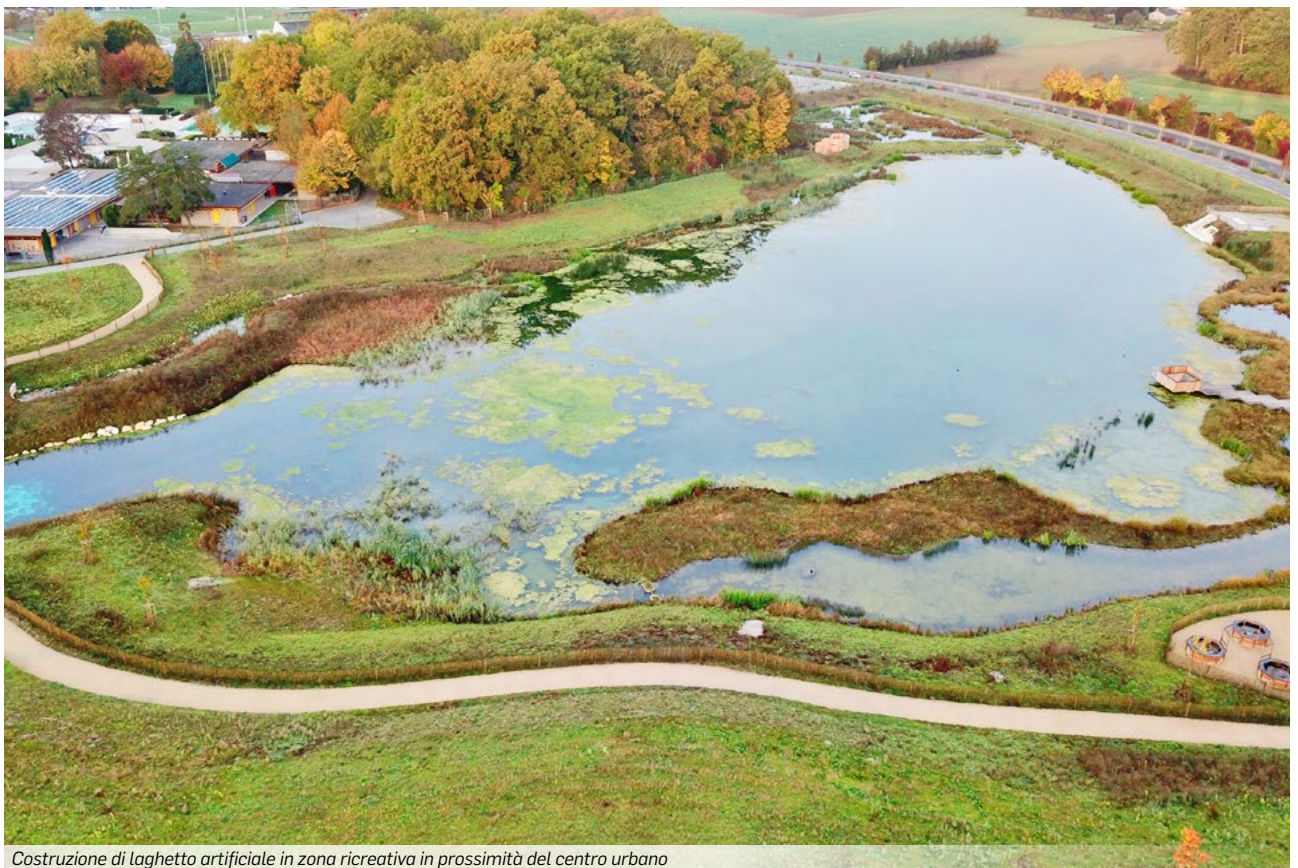
Costruzione di laghetto artificiale in zona ricreativa in prossimità del centro urbano