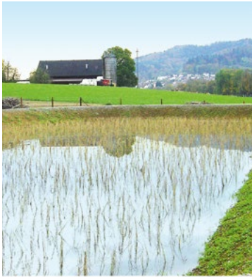
Bacino di ritenzione e filtrazione