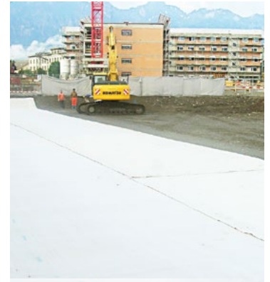
Risanamento di sito contaminato