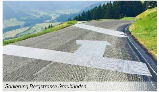
Sanierung Bergstrasse Graubünden