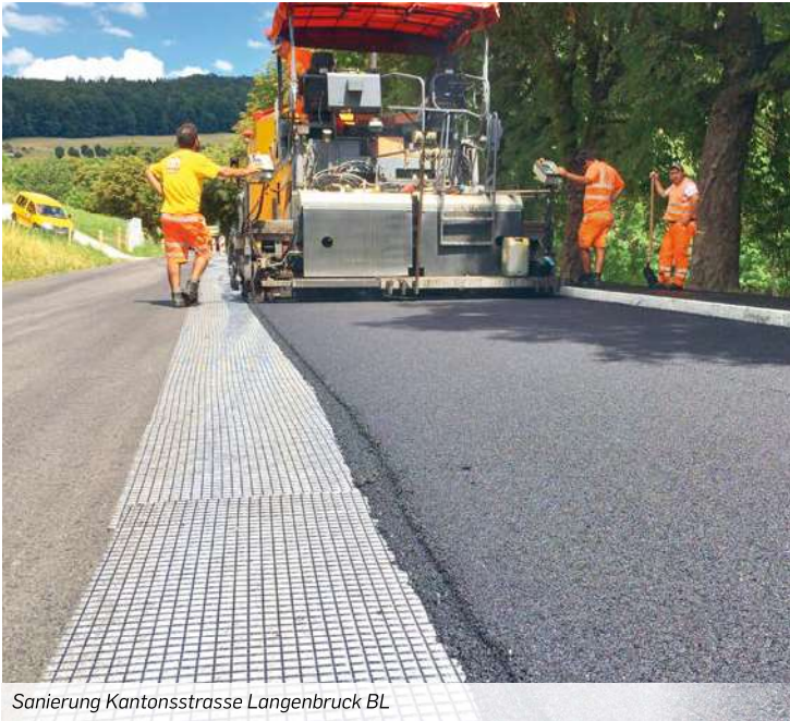
Sanierung Kantonsstrasse Langenbruck BL