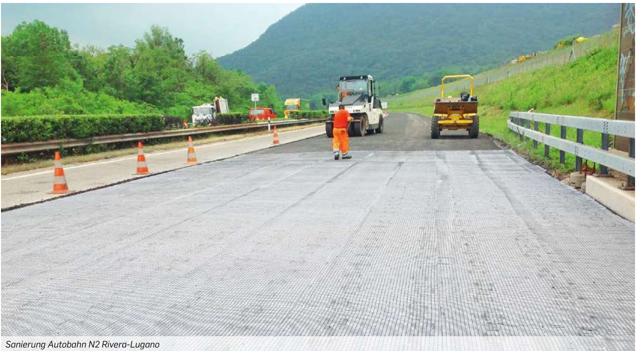
Sanierung Autobahn N2 Rivera-Lugano