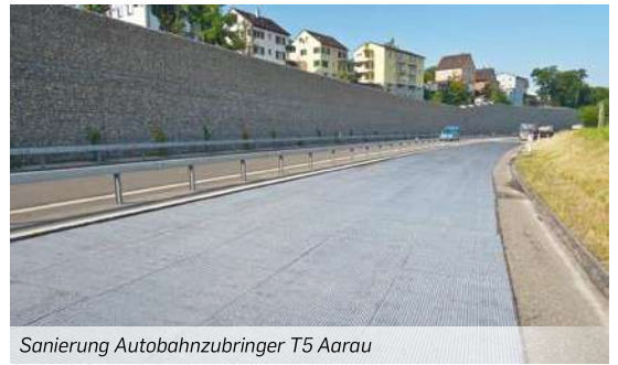
Sanierung Autobahnzubringer T5 Aarau