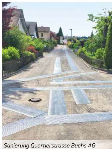
Sanierung Quartierstrasse Buchs AG