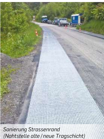
Sanierung Strassenrand (Nahtstelle alte / neue Tragschicht)